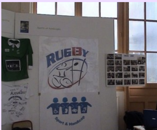
Education physique et sportive